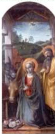
Angelo Scola CARдинаLE ARCIVESCOVO DI MILANO

Con l'aiuto di don Andrea e delle sempre generose suore della nostra parrocchia, potremo raggiungere più famiglie, magari privilegiando quelle che non abbiamo potuto incontrare lo scorso anno.